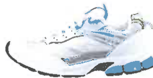
Baskets aux pieds